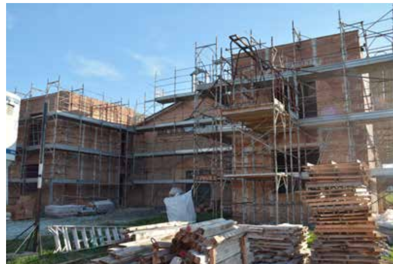
Il cantiere della nuova Casa Italia Cina di Savignano

Se ti interessa conoscerci meglio, puoi contattarci o visitare il sito www.casaitaliacina.it .